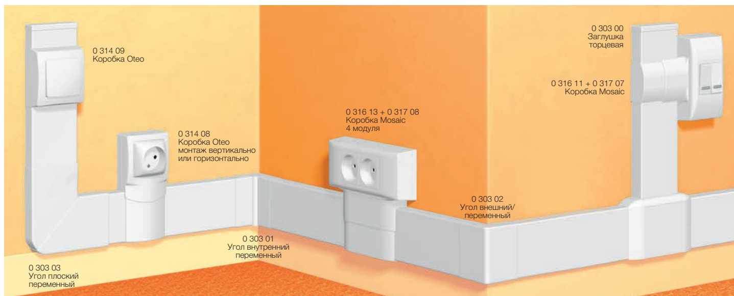
Таблица выбора стр. 870 Таблица емкости мини-плинтусов стр. 869