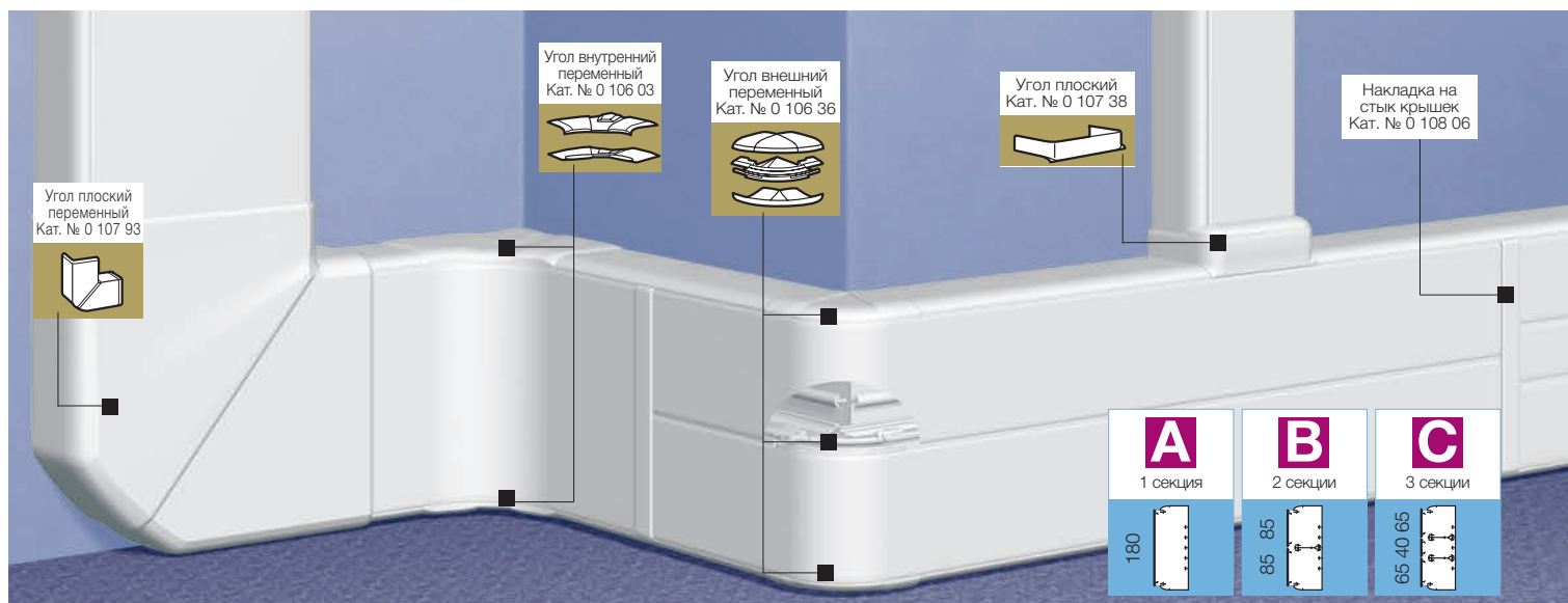
Таблица выбора стр. 888-889 Таблица ёмкости кабель-каналов стр. 887