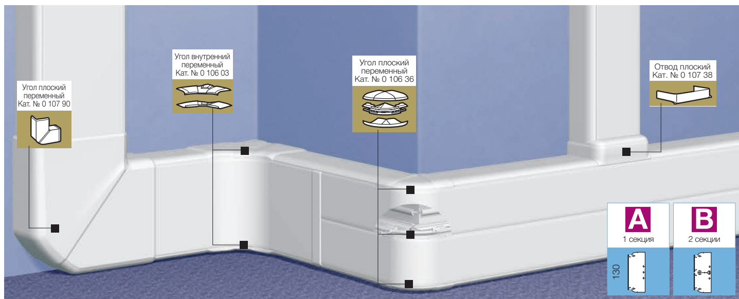
Таблица выбора стр. 888-889 Таблица ёмкости кабель-каналов стр. 887