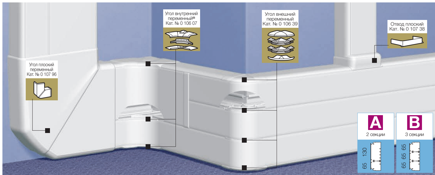
Таблица выбора стр. 888-889 Таблица ёмкости кабель-каналов стр. 887